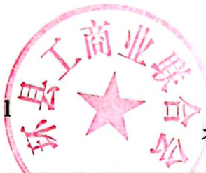
表一、单位收支总体情况表