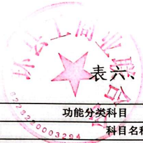
表六、一般公共预算支出情况表