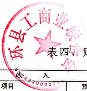
表四、财政拨款收支总体情况表