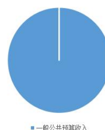
图一：预算收入构成